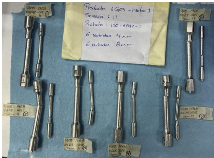
Imagen 4. Ruptura de ítems. Image 4. Broken items.