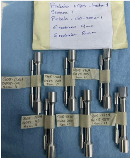
Imagen 1. Identificación de ítems. Image 1. Items identification.