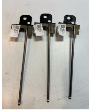
Imagen 1. Identificación de items. Image 1. Item identification.