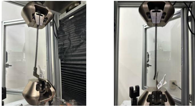
Imagen 2. Ensayo de items. Image 2. Test.