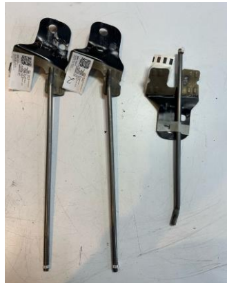
Imagen 3. Items ensayados. Image 3. Tested items.