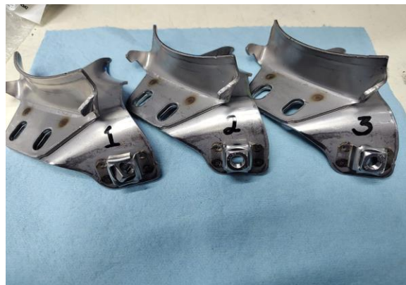
Imagen 3. Items ensayados. Image 3. Tested items.

Mess Servicios Metrológicos S. de R.L. de C.V. Acceso III, No. 16A, Nave 10, Parque Industrial Benito Juárez, Querétaro, Qro.