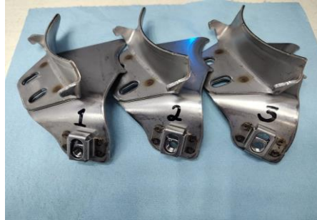
Imagen 1. Identificación de items. Image 1. Item identification.