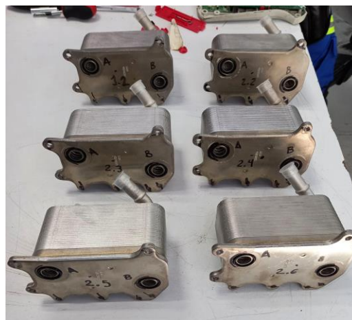
Imagen 3. Items ensayados.

MESS S.C. Acceso III, No. 16A, Nave 10, Parque Industrial Benito Juárez, Querétaro, Qro.