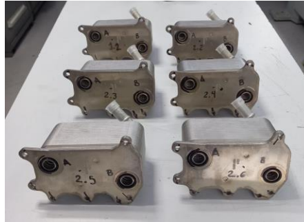
Imagen 1. Identificación de items. Image 1. Item identification.