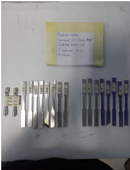
Imagen 1. Identificación de items. Image 1. Items identification.