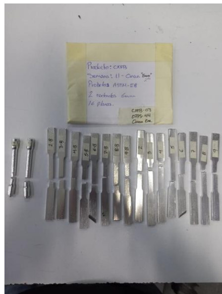
Imagen 4. Ruptura de items. Image 4. Broken items.

Mess Servicios Metrológicos S. de R.L. de C.V. Acceso III, No. 16A, Nave 10, Parque Industrial Benito Juárez, Querétaro, Qro.