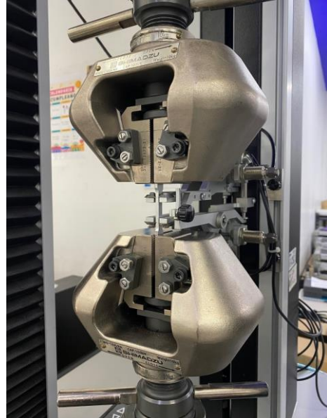
Imagen 2. Inicio de ensayos. Image 2. Test.