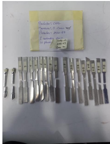
Imagen 4. Ruptura de items. Image 4. Broken items.

Mess Servicios Metrológicos S. de R.L. de C.V. Acceso III, No. 16A, Nave 10, Parque Industrial Benito Juárez, Querétaro, Qro.