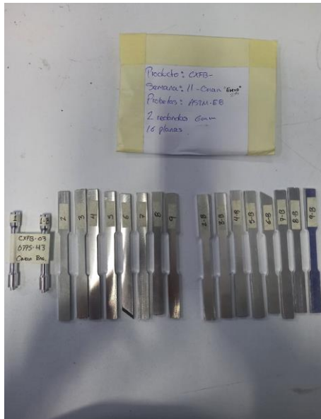
Imagen 1. Identificación de items. Image 1. Items identification.