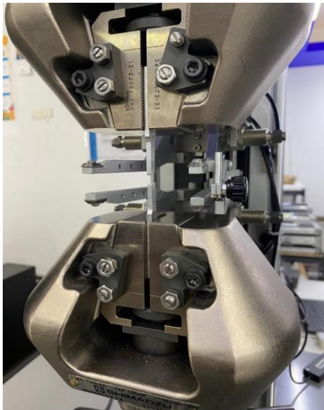
Imagen 3. Item a la ruptura. Image 3. Item at break.