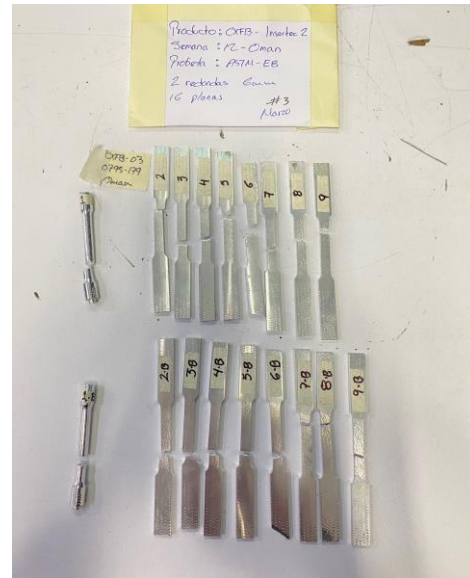
Imagen 4. Ruptura de items. Image 4. Broken items.

Mess Servicios Metrológicos S. de R.L. de C.V. Acceso III, No. 16A, Nave 10, Parque Industrial Benito Juárez, Querétaro, Qro.