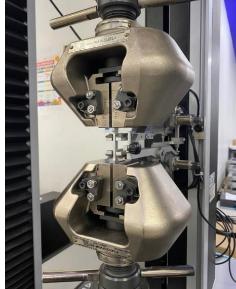
Imagen 2. Inicio de ensayos. Image 2. Test.