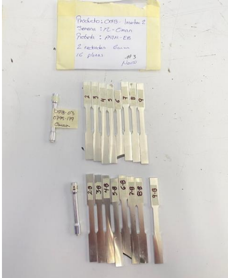
Imagen 1. Identificación de items. Image 1. Items identification.