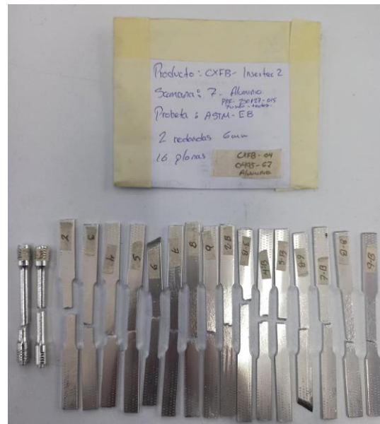
Imagen 4. Ruptura de items. Image 4. Broken items.

Mess Servicios Metrológicos S. de R.L. de C.V. Acceso III, No. 16A, Nave 10, Parque Industrial Benito Juárez, Querétaro, Qro.