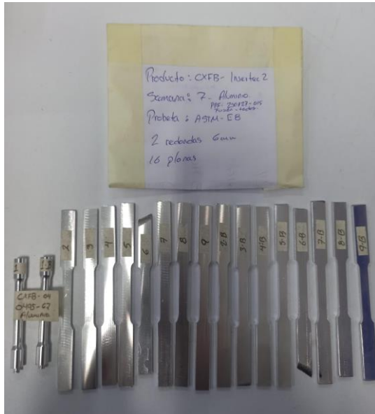
Imagen 1. Identificación de items. Image 1. Items identification.