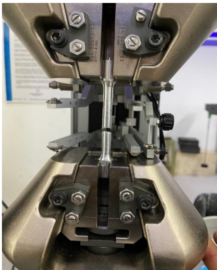
Imagen 3. Ítem a la ruptura. Image 3. Item at break.