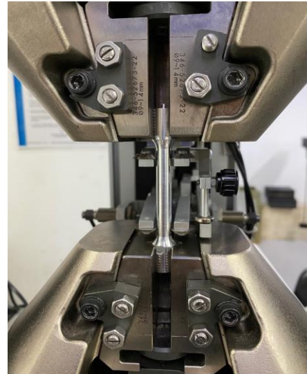
Imagen 2. Inicio de ensayos. Image 2. Test.