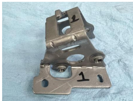
Imagen 3. Items ensayado. Image 3. Tested items.

MESS S.C. Acceso III, No. 16A, Nave 10, Parque Industrial Benito Juárez, Querétaro, Qro.