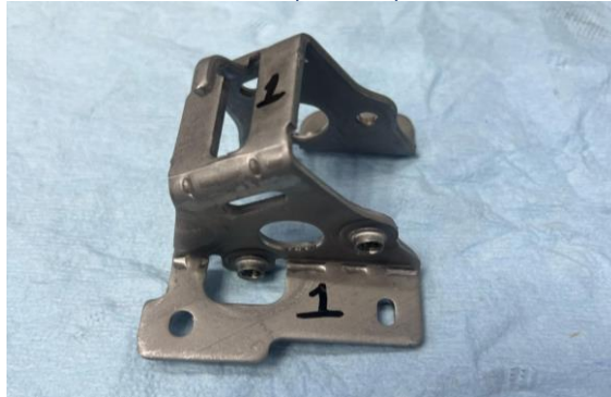
Imagen 1. Identificación de items Image 1. Items identification.